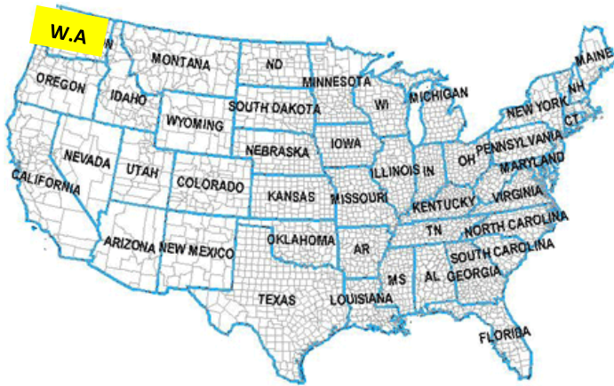
A-H3N8 A-H5N2 A-H5N8 A-H10N7 Patos, Gansos, Gallinas de Guinea, Gallinas, Aves Silvestres, Focas