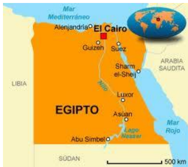
A-H5N1 Gallinas, Humanos