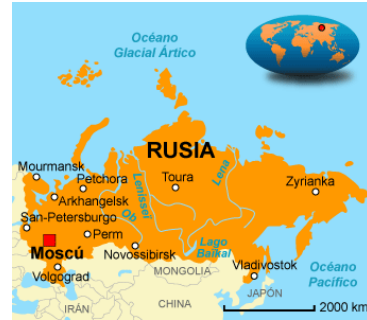
A-H5N8 A-H5N1 Aves Silvestres, Ponedoras