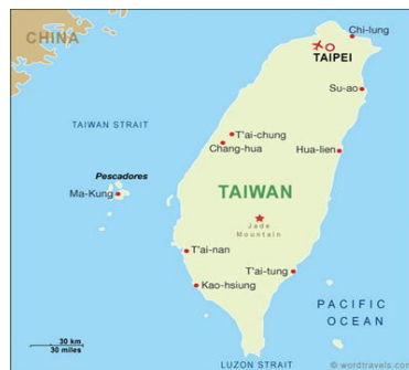
A-H7N9 Patos, Aves Silvestres