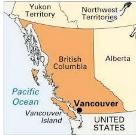
A-H5N2 A-H7N3 Reproductoras, Pollos, Pavos, Gansos, Aves Silvestres