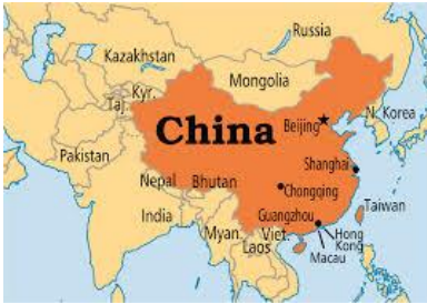
A-H7N9 A-H5N6 A-H5N8 Humanos, Gansos, Patos