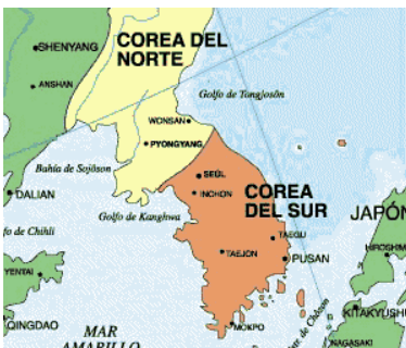
A-H5N8 Patos, Gansos, Ponedoras, Aves Silvestres