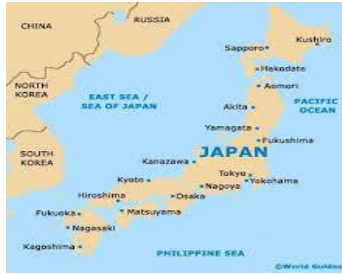
A-H5N8 Aves Silvestres