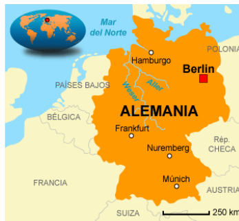
A-H5N2 A-H5N8 Gallinas, Patos, Pavos, Aves Silvestres