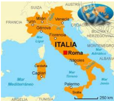
A-H5N8 Gallinas, Pavos