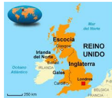
A-H5N8 Ponedoras, Pavos, Aves Silvestres