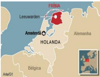
A-H5N8 A-H10N7 Ponedoras, Reproductoras, Patos, Aves Silvestres, Focas