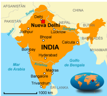
A-H5N1 A-H5N8 Patos, Gansos, Humanos, Aves Silvestres