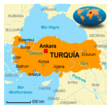
A-H5N2 Ponedoras, Aves Silvestres